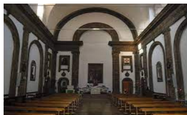
Parrocchia “S. Biagio”

Domenica 10 dicembre 2023 – II Domenica di Avvento