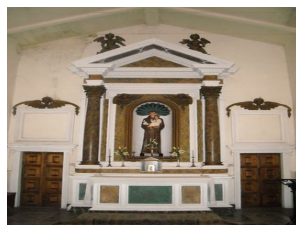
Chiesa S. Antonio