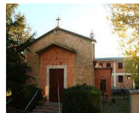
Chiesa S. Rita - Grilli