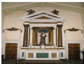
Chiesa S. Antonio